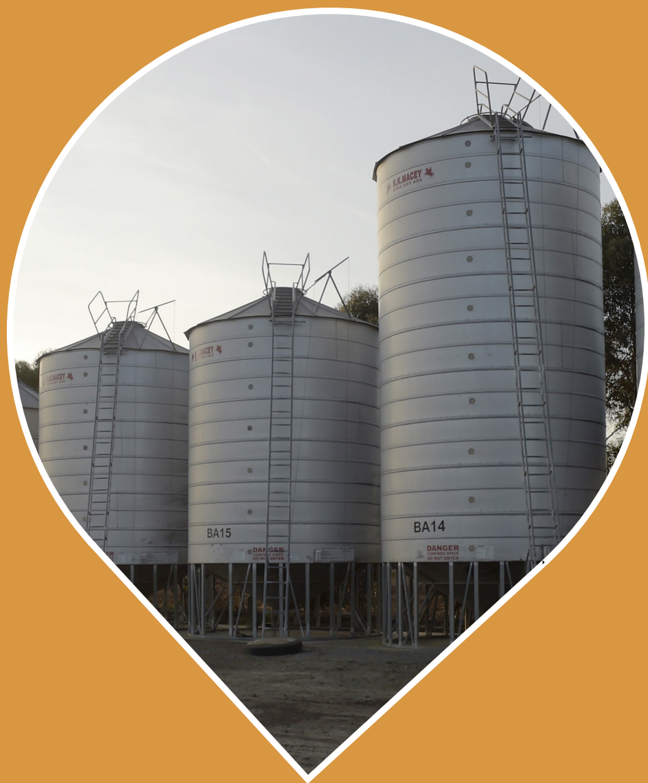
Exemple d'une installation pour le TRAITEMENT AU CO 2 À PRESSION ATMOSPHÉRIQUE

Vos rotations vous permettent un traitement d'1 à 3 semaines ?