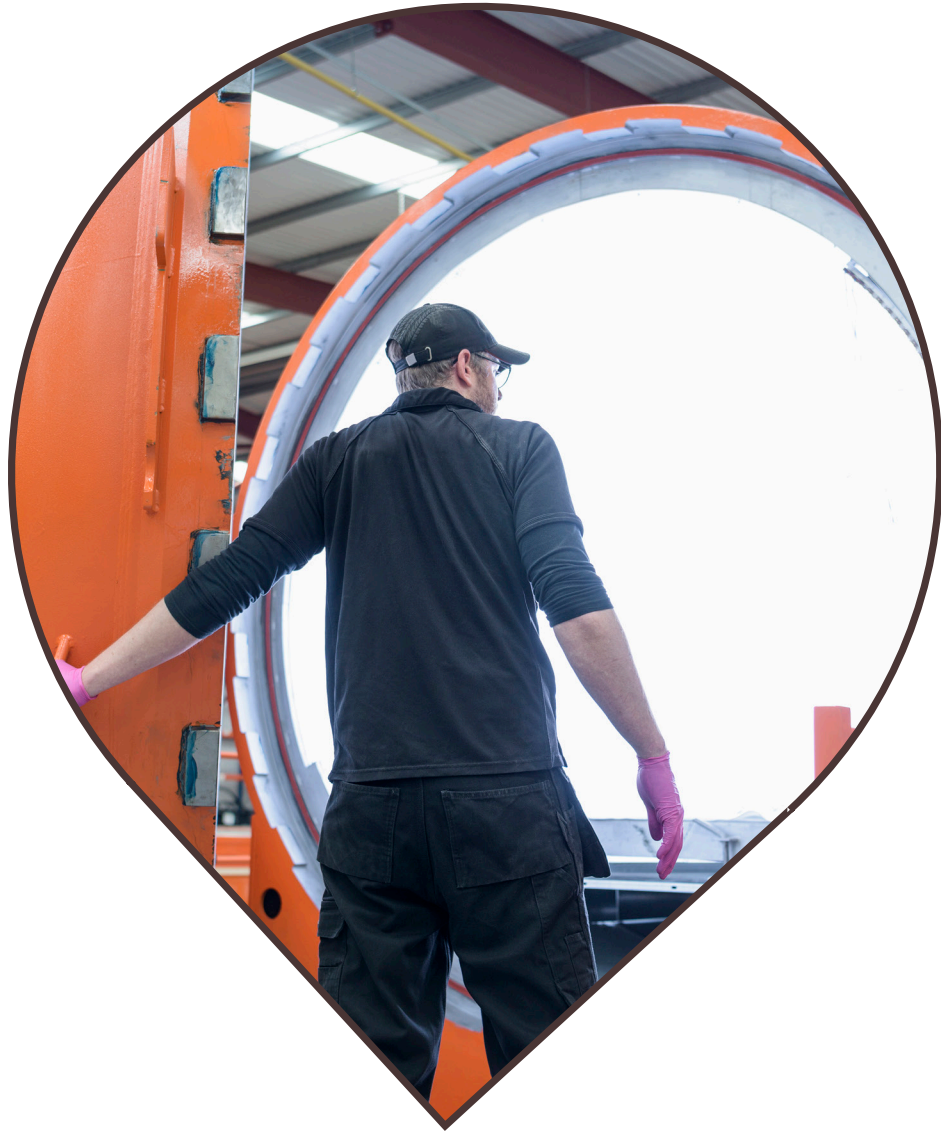
Exemple d'une installation pour le TRAITEMENT AU CO 2 EN AUTOCLAVE