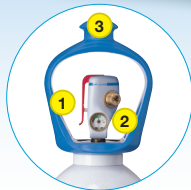
SMARTOP™ Pratique et simple