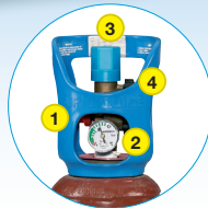
MINITOP™ Le prêt à l'emploi