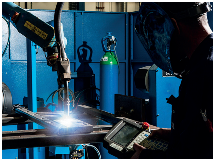
Soudage MAG robotisé

La solution gaz de protection haute performance pour le soudage MAG à grande vitesse des aciers carbone