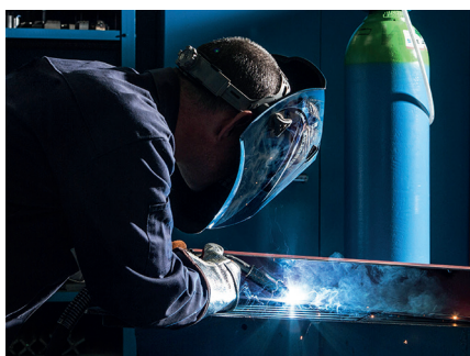
Soudage MAG manuel