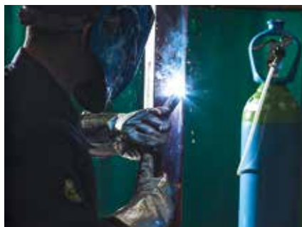
Soudage MAG de l'acier carbone

La solution gaz de protection haute performance pour le soudage MAG des fortes épaisseurs