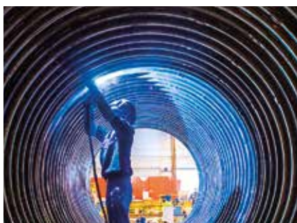
Adapté aux fortes épaisseurs