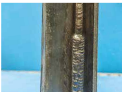
Soudage multi-passes en verticale montante

ARCAL™ Force vous garantit une qualité constante et une utilisation en toute simplicité, quelles que soient les quantités dont vous avez besoin, de la bouteille jusqu'au liquide